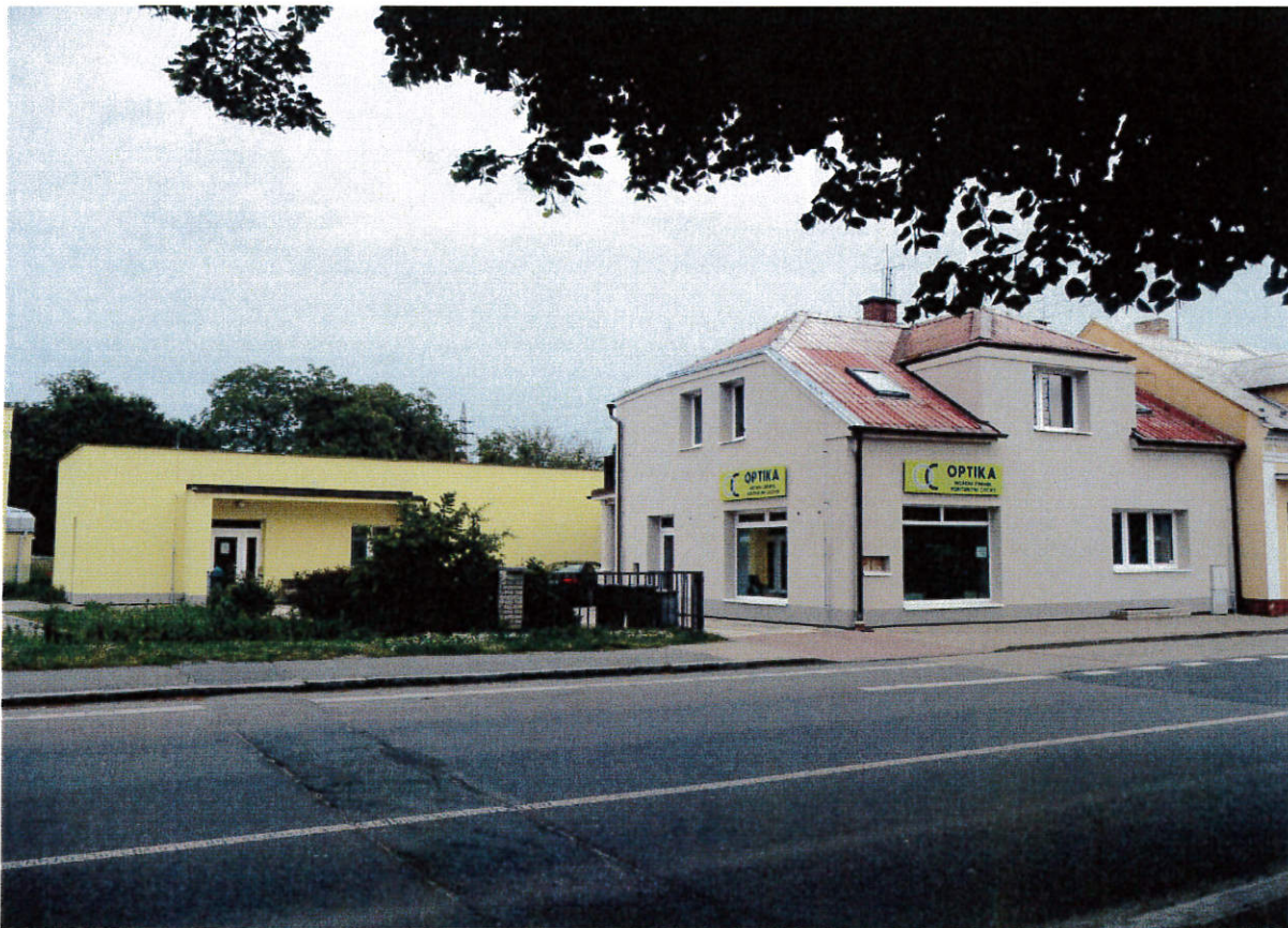
Po realizaci projektu