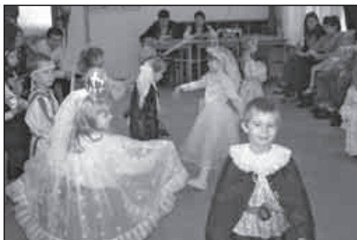
Karneval v klubu dětí a mládeže pro nejmenší