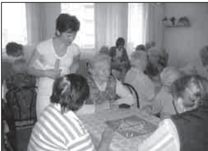
Při soutěži ve hře „Člověče, nezlob se“ nechyběla hráčská vášeň a radost ze hry.