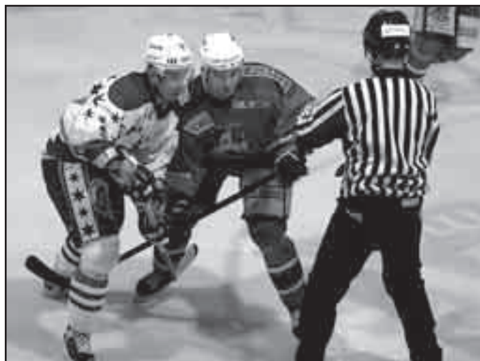
HC Benátky nad Jizerou se střetl s HC Havlíčkův Brod v druhém zápase série play-off 3. března (1 : 2).

Branky: 13. Nedbal (Kaňkovský, Jakeš), 17. Zeman (Jakeš), 35. Kubišta (Zajíček), 43. Weiss (L. Krupka), 60. Zajíček - 29. Šesták (Kříž), 47. Loskot (Vyskočil, Němec), 55. Kristek (Loskot). Rozhodčí: Chlaň, Vyloučení: 3:3, navíc domácí Zajíček 10 minut, Využití: 0:0, Oslabení: 0:0, Diváků: 800. HC Benátky: Barek - Čech, Nedbal, Pešek, Hart, Klaban, Zeman - Nekvasil, L. Krupka, Oberreiter - Zajíček, T. Kadeřábek, Kubišta - Kocman, Kaňkovský, Jakeš - Rybín, Skořepa, Weiss. Trenéři: Ladislav Kolda a Aleš Vladyka.