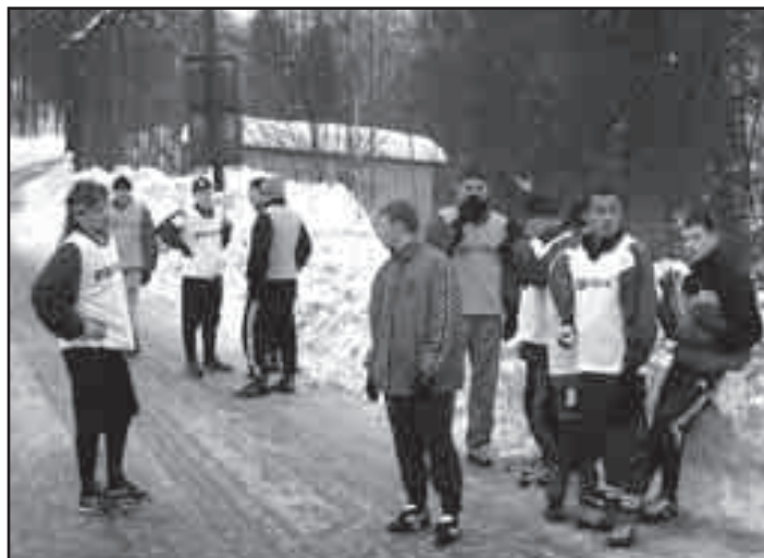
Trenink přípravy na únorovém soustředění v Šumperku nad Desnou