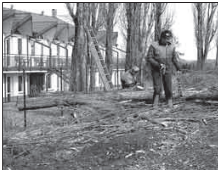
Odstranění topolového stromořadí za areálem domova důchodců provedla odborná firma Petr Kerber z Otradovic.

Sběr slouží obyvatelům města, fyzickým osobám. Podnikatelé mohou tohoto systému využít, pokud mají uzavřenou smlouvu s městem nebo mohou výše uvedené odpady nechat zneškodnit na vlastní náklady u odborných firem (doklad uschovat).