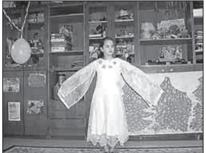
Maškarní ve školní družině Základní školy Pražská