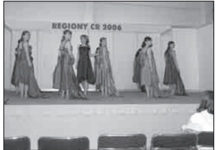
Vystoupení žáků tanečního oboru: Vítězslav Novák - Ranoša, z cyklu Balady