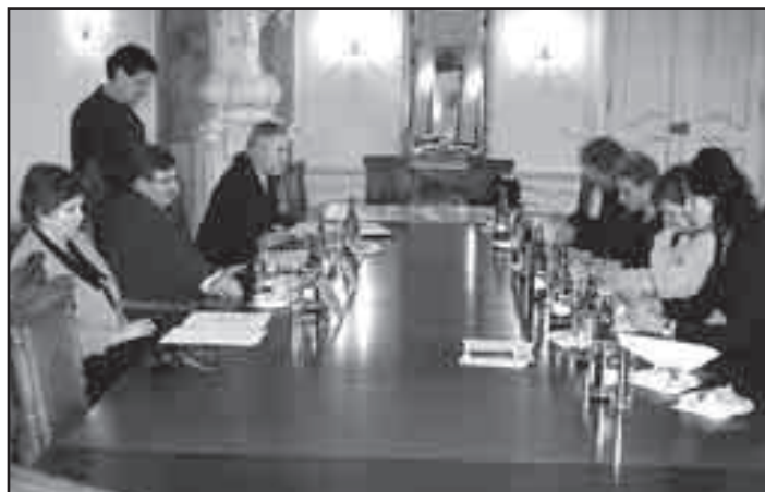
Z první tiskové konference ve velké zasedací místnosti

Zastupitelstvo rozhodlo o odstranění topolového stromořadí za objektem domova důchodců. Důvodem je havarijní stav stromů, kterým je ohrožována budova domova. Stromořadí bude nahrazeno výsadbou nových stromů, nikoli však topolů, které svoji výškou nejsou pro toto místo vhodné.